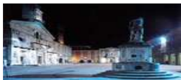
Piazza Prampolini Reggio Emilia

Il programma comprende anche paratiroidi e linfonodi. Esso mantiene il caratteristico orientamento pratico: dimostrazioni "dal vivo" in videoconferenza interattiva, brevi premesse, ampie esercitazioni.